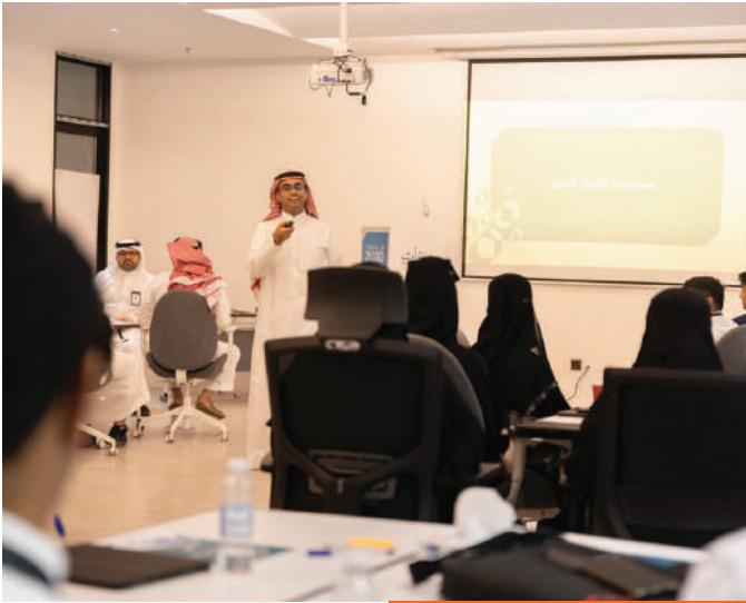
برنامج الشركات الناشئة الجامعية