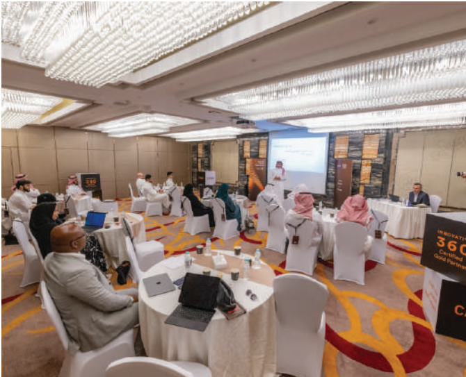
دورة قائد الابتكار Capil التطبيقي