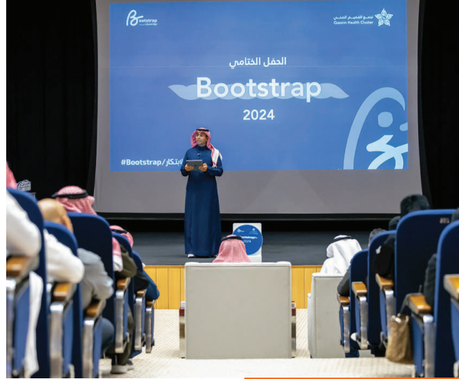
معسكر بوت ستراب