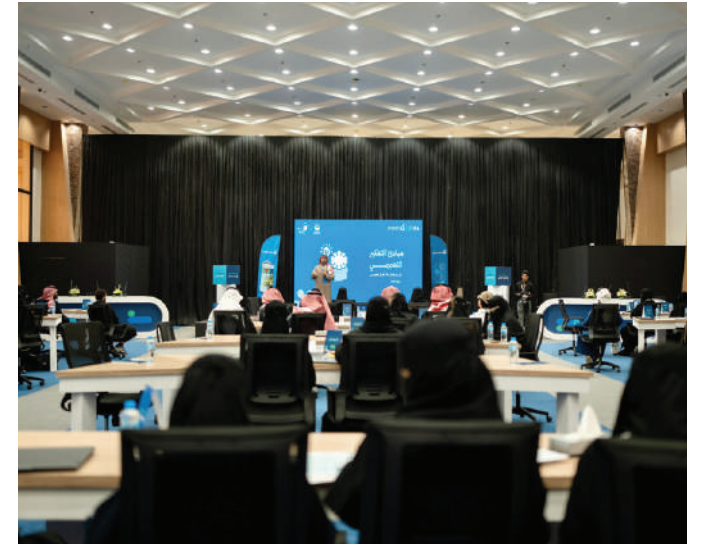
تحدي جادة نون التابع لبنك التنمية الاجتماعية