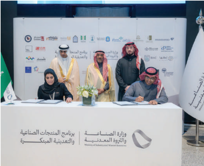
برنامج المنتجات الصناعية والتعدينية المبتكرة