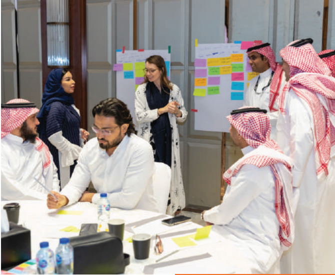
السرد القصصي - الصحة القابضة