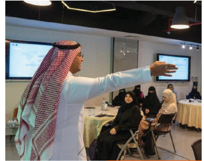
مسرعة أعمال النشر