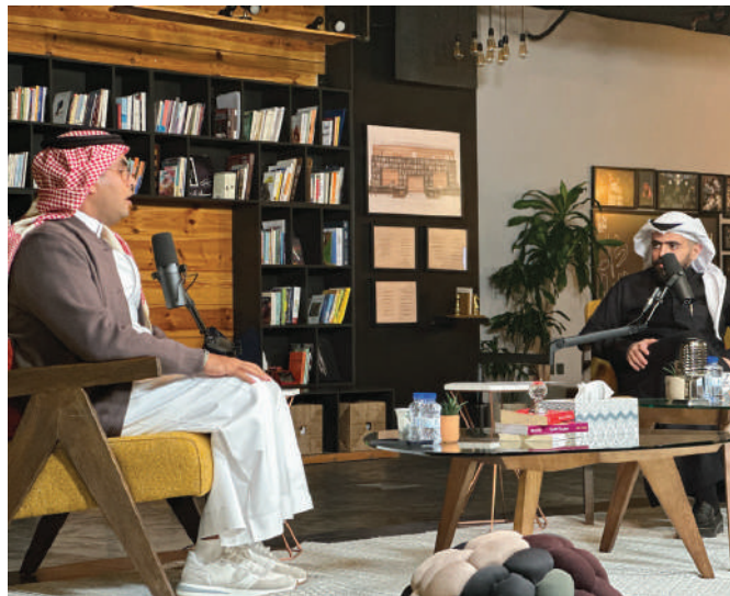
لقاء الابتكار بالمنظومة الصحية - ذا ستيج