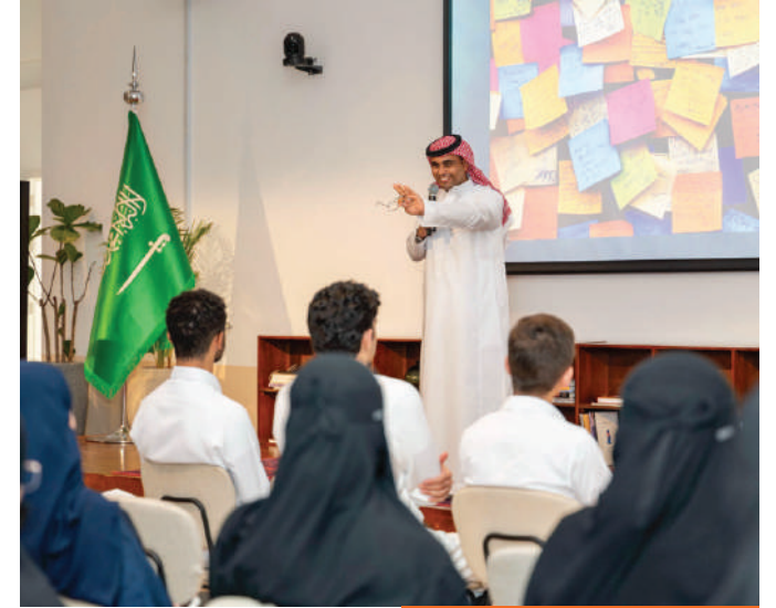
هاكاثون تقنيات اللغة العربية وزارة الثقافة