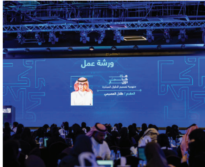
هاكاثون إنجاز لرفع الإنتاجية في القطاعات الحكومي والخاص باستخدام الذكاء الاصطناعي