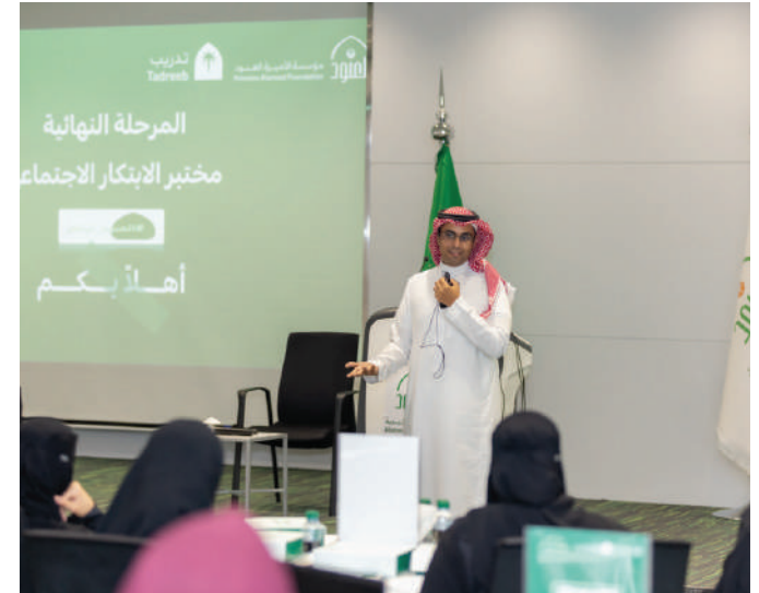
هاكاثون الابتكار الاجتماعي الثاني مؤسسة العنود الخيرية